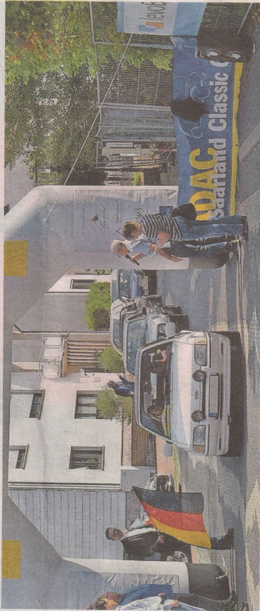
Zieleinfahrt bei der Oldtimerrallye

Trotz Corona-Beschränkungen nahmen 39 Teilnehmer an der Oldtimer-Fahrt des MSC Eppelborn um den Levo-Bank-Pokal teil.