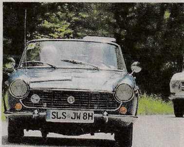
Der ADAC-Classic-Cup macht Station in Eppelborn.

Der Start des ersten Fahrzeugs ist für 11.01 Uhr auf dem Marktplatz vorgesehen. „Auf den 120 Kilometern der Ausfahrt warten kleinere Aufgaben und Geschicklichkeitsprüfungen. Wir hoffen, dass die Teilnehmer die ausgesuchte Strecke durch unser schönes Bundesland gefällt“, erklärt Fahrleiter Nikolas Wark. Nach dem Start in Eppel-